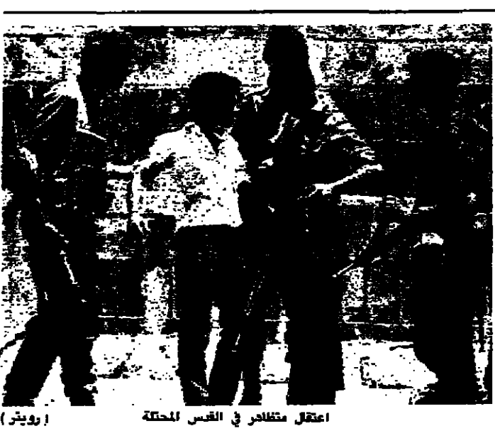
اعتقل متظاهر في القدس المحتلة